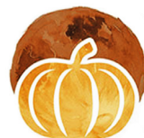
Tháng 10 Trăng Thu Hoạch