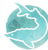
Tháng 8 Trăng Cá Tầm