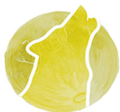
Tháng 1 Trăng Sói

Đảm bảo bạn mặc quần áo phù hợp với thời tiết và nếu có thể, hãy mang theo đèn pin để định hướng đường đi.