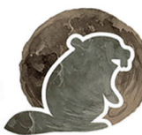
Tháng 11 Trăng Hải Ly