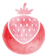
Tháng 6 Trăng Dâu