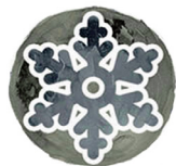
Tháng 2 Trăng Tuyết