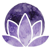
Tháng 5 Trăng Hoa