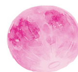
Tháng 4 Trăng Hồng