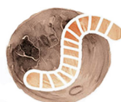
Tháng 3 Trăng Sâu