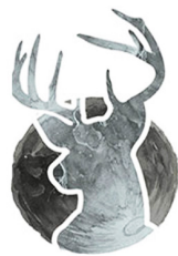
Tháng 7 Trăng Hươu